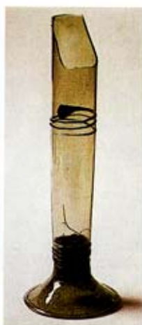
T.v. pasglas fundet i København. T.h. rådhusglasset fra Odense 1880.

Fra de fleste danske og sydsvenske glasværksteder og fra mange byudgravninger er der fundet skår af pasglas. Datidens drikkeskik er dog skyld i, at der stort set ikke er bevaret nogen hele pasglas. Ved udgravninger i København, fra Riberhus i Ribe og fra Rosenholms voldgrav er fundet omtrent intakte, glatte pasglas.