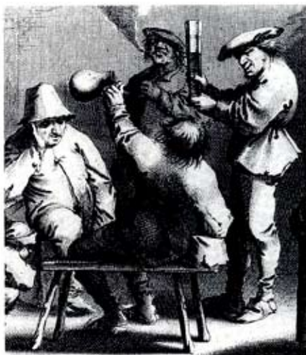
Drikkelag. Bonden til højre holder et pasglas frem. – Stik af Pieter Nolpe.

Den lysgrønne farve, der er karakteristisk for både middelalderens og renæssancens glas, skyldes, at glasset blev fremstillet af lokalt opgravet sand og potaske, dvs. aske fra bøgetræ. Den grønne tone skyldes, at sand altid indeholder en smule jern, og farven varierer efter sandets jernindhold. Dette grønne