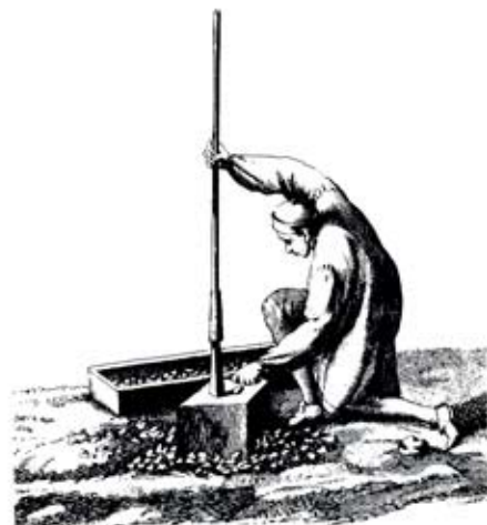
Glasmaker arbejdende med formklods. – Diderot og d' Alemberts encyklopædi.

glas kaldes populært for waldglas (dvs. skovglas), fællesbetegnelsen for nordeuropæisk glas fra middelalder og renæssance.