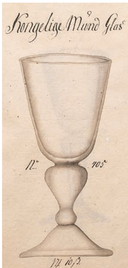
Kongeligt mundglas fra Nøstetangens modelbog.

Sættene af drikkeglas, vandglas og karaffer indvarslede den nye bordskik, som blev udbredt i 1700-årene. Man fik et øget behov for flere størrelser og typer af glas, og overalt i Europa begyndte man så småt at udvikle egentlige glasservicer. Fra midten af 1700-årene blev der fra Nøstetangens Glasværk udbudt flere typer glas i to eller tre størrelser. I værkets katalog kan man konstatere, at man skelnede mellem vinglas, dessertglas, vandglas, ølglas og brændevinsglas. Dertil kom karaffer, som efterhånden indgik som en vigtig del af